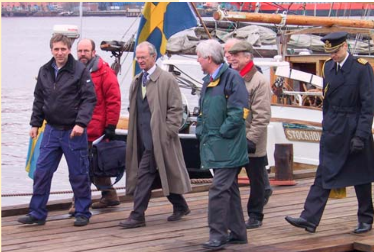
Konung Carl XVI Gustaf på besök i Sjögården.

På Sjögården hemsida www.sjogard.se kan man ladda ner våra remissvar, vår Sjögårdspromenad och få en kulturhistorisk beskrivning av Sjögårdens område.