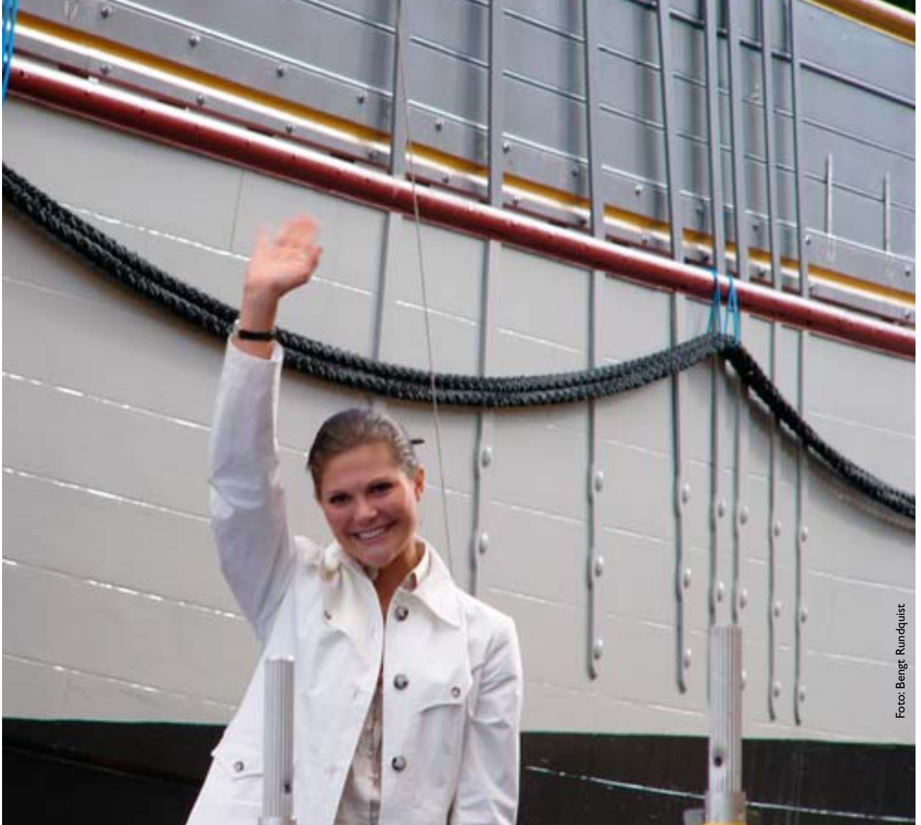
Kronprinsessan Victoria förrättade dopet av Briggen Tre Kronor som byggdes på Skeppsholmen.